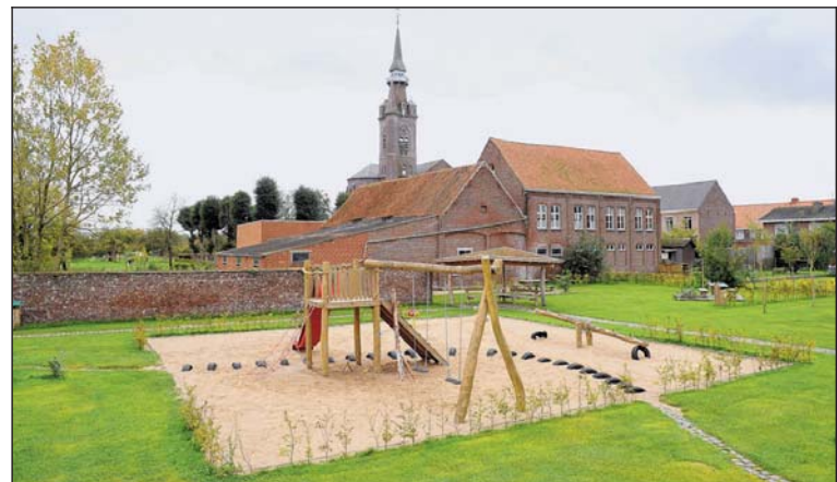
De aankoop en inrichting van Het Disveld was niet voorzien. Het gemeentebestuur maakte goed gebruik van een plotse opportuniteit.

Over 12 maanden, op zondag 14 oktober 2012, zijn er gemeenteraadsverkiezingen. Je voelt de politieke spanning Ruiselede stilaan stijgen. Tijd om eens te kijken wat RKD de afgelopen jaren waarmaakte van de verkiezingsbeloftes. RKD haalde net geen 50 % van de stemmen, maar kon dankzij de overwinnaarsbonus rekenen op een volstrekte meerderheid. De partij had naast een slogan ook een uitgebreid programma, dat maar liefst 83 punten telde. Daarvan is vijf jaar later ongeveer 75 % van gerealiseerd.